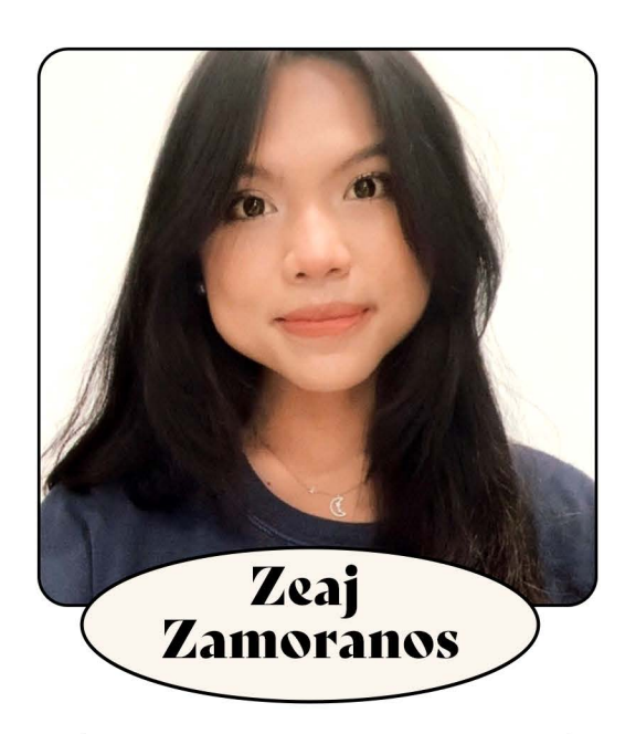
Coordinatrice de la communication des Emplois d'été Canada (EEC)

«J'aimerais remercier l'Institut en langues des signes du Canada (ILSC) de m'avoir donné l'occasion de travailler avec une équipe formidable. J'ai pu nouer des liens et développer des possibilités de partenariat avec des Sourds canadiens. L'ILSC m'a ramené à la maison et j'aimerais remercier la Société culturelle canadienne des Sourds d'avoir fait en sorte que cela se produise.»