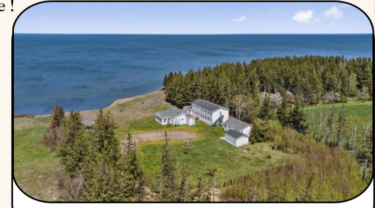
Une nouvelle masison et un lieu de retraite à Grande Digue, au Nouveau-Brunswick

Nous espérons vous voir au festival national des arts et de la culture des Sourds, 31 juillet - 4 août 2024, à Halifax, en Nouvelle-Écosse!